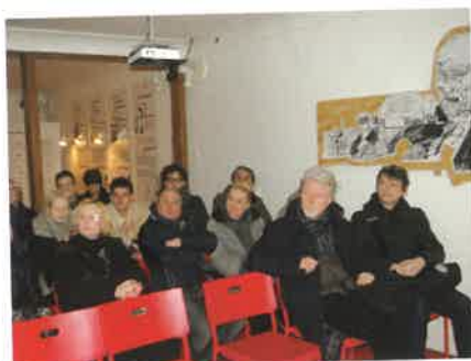
Tým inscenace Plačícího satyra ve Šrámkově domě.