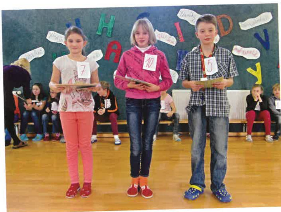
finalisté recitační soutěže