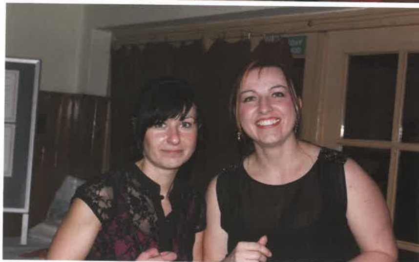
ohlédnutí za letošním městským plesem