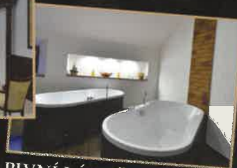
PIVNÍ LÁZNĚ A MASÁŽE